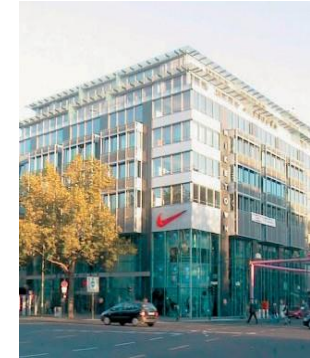
Neubau eines Geschäftshauses am Kurfürstendamm 10789 Berlin

Die zahlreichen, erfolgreich abgeschlossenen Projekte im Bereich der Verwaltungs-, Schul- und Wohnbauten bilden den soliden Grundstein unserer Tätigkeiten. Unsere Geschäftspartner und Kunden profitieren dabei von unseren langjährigen Erfahrungen, u. a. in allen Leistungsphasen der HOAI §34.