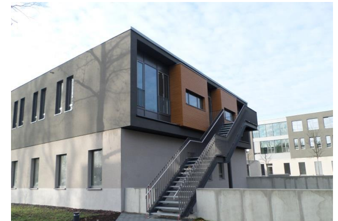
Neubau Oskar – Helene – Heim „Medizinisches Versorgungszentrum“ im Berliner Ortsteil Dahlem